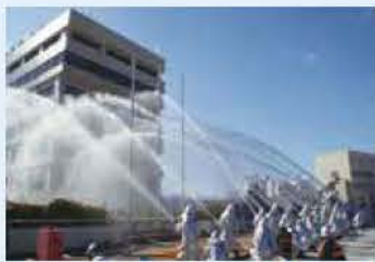
消防団による迫力ある放水

場所/市役所北側、市民会館 内容/▷午前10時~式典 ▷午前11時~入場行進、子ども消防隊パレード ▷午前11時30分~救助隊演技、消防団一斉放水演習 ▷消防車両展示コーナー(午前10時~10時45分) ※雨天時は式典のみ