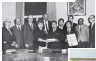
姉妹都市提携を締結