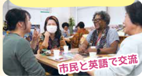
市民と英語で交流

茶道や座禅、大漁旗染めなどの日本文化体験や、市民と英語で互いの市を紹介しあうなど、交流を楽しみました。