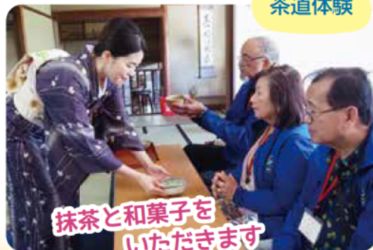
抹茶と和菓子をいただきます