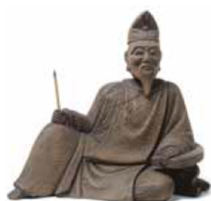
柿本人麿像 (市指定文化財、月照寺所蔵)

観覧料／大人200円、大高生150円(中学生以下無料)、障害者手帳などの提示で半額