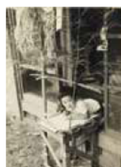
昭和46年ごろ七夕かざりをする少年