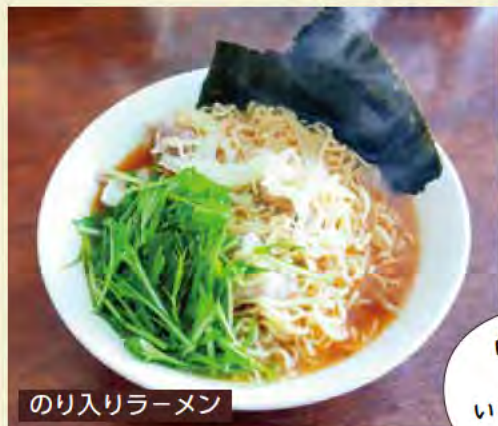
のり入りラーメン