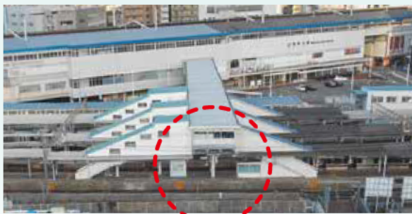
このあたりに改札口ができます

改札口の新設にあわせて、エレベーターを設置。高齢者や車いす・ベビーカーを利用する人も安心して利用できるようになります。