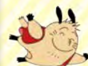
まちに賑わいが 戻ってきたね