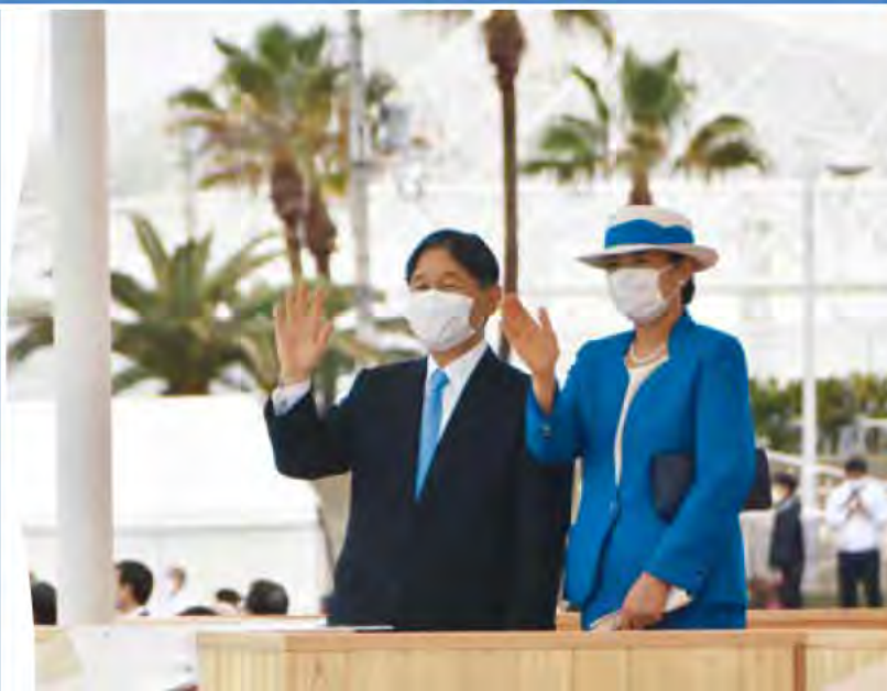
中崎のペランダ護岸で、漁船団パレードに手を振られる天皇、皇后両陛下