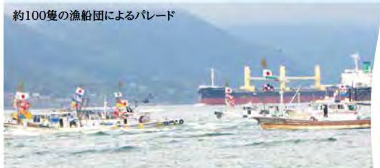
約100隻の漁船団によるパレード