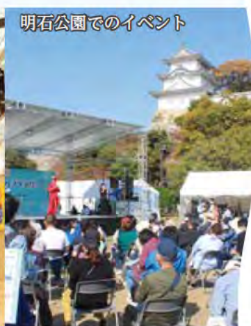
明石公園でのイベント