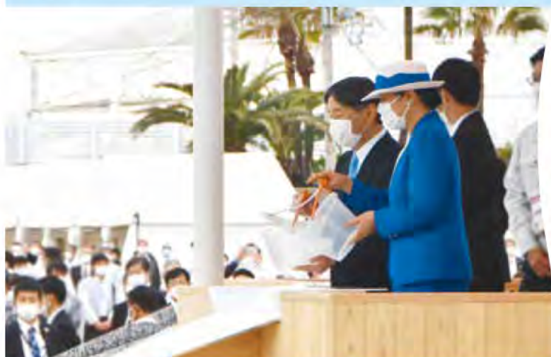
天皇、皇后両陛下による稚魚の放流

同大会は、天皇后両陛下が出席される地方公務「四大行幸啓」の一つで、兵庫県は全国初の2回目の開催となりました。