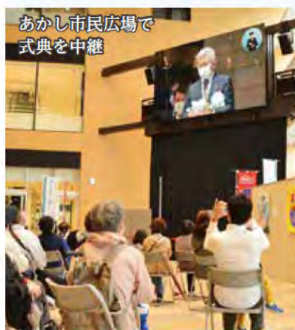
あかし市民広場で 式典を中継