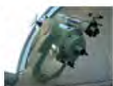
16階観測室の40cm反射望遠鏡

／1人300円(駐車料金別途200円) 申し込み／1月7日午後5時まで同館ホームページで受け付け。応募多数時抽選