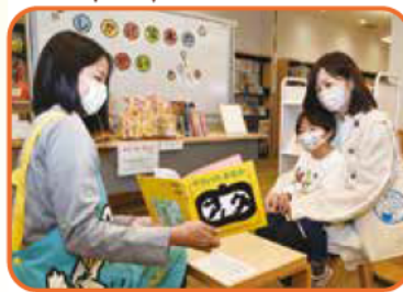
乳幼児健診時、ふれあいの時間を通して親子に絵本をプレゼント