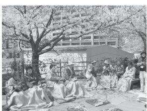
ふれあいピクニック:桜の花の下で

お魚タッチプールやタコ釣り、アナゴつかみ、明石焼体験、魚の食べ比べコンテストなどの参加型イベントのほか、音楽ステージや明石の食を集めたブーシの出店など「魚のまち明石」を体感できる楽しさ満載の2日間です。主催/NPO法人明石海浜振興会 日時/5月22日(土) 午前11時～午後6時、23日(日) 午前10時～午後5時 場所/大蔵海岸多目的広場 お問い合わせ/同振興会事務局 (☎9225554)