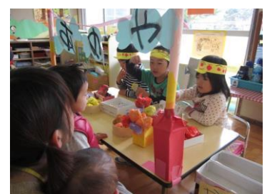
お店屋さんごっこ 未就園児をご招待

幼稚園が親と子の育ちの場となるよう、家庭・地域・関連機関との連携を図り、センター的役割を果たします。