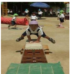
好きな遊びで 跳び箱に挑戦

各市立中学校に1園、預かり保育実施園を設置しています。対象は実施園に在籍する園児で、実施日は4月1日~3月31日(土日祝年末年始除く)です。弁当日の実施時間は14:00~16:00、1回400円、弁当のない日の実施時間は、11:50~16:00、1回600円です。長期休業中も8:40~16:00、1日1,100円で実施しております。詳細は実施園に確認してください。