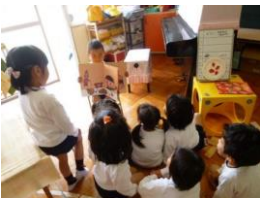
子ども達による絵本の読み聞かせ

見立てやごっこ遊び等の活動を通して、想像力を豊かにし、自分の考えを表現しながら言語能力を培います。