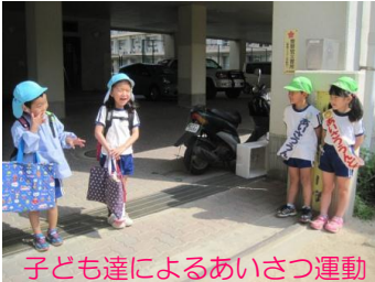
子ども達によるあいさつ運動