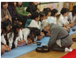
地域の方によるお茶会

保育所・小学校・中学校等教職員同士の相互理解を深めたり、交流活動を積極的に行ったりします。