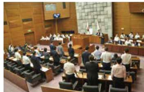
賛成多数で修正案を可決

6月30日の本会議では、市民全員・事業者サポート事業について、給付額を1人当たり3千円から2千円に減額する令和5年度明石市一般会計補正予算(第3号)の修正案を賛成多数で可決しました。