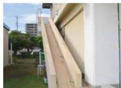
避難にも使える滑り台

物で、2階の収容人員が20人以上の場合は避難器具が必要となる。幼稚園・保育所に設置されている滑り台も避難器具の一種で、いざ避難する場合も遊び慣れた遊具のため、園児にとつて有効とされている。