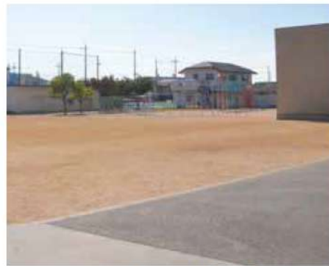
児童数のピークは令和7年度

なかつた。今後は、小学校の敷地内の幼稚園や放課後児童クラブを含めた利用教室の再配置や校舎の高層化等を検討していきたい。