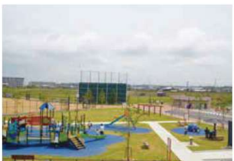
無料開放は9月30日まで(17号池魚住みんな公園)

委員からは、みんなにやさしいをコンセプトに掲げた公園を有料にする意図や料金体系について質問がありました。市からは、良好なグラウンド状態を維持するためには、管理人の設置や定期的なメンテナンスの費用が必要となること