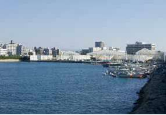
中心市街地の南の拠点

ことにより、さらなるにぎわいの創出を図るとした明石港東外港地区再開発計画を策定している。同計画では、民間によるにぎわいづくりを基本コンセプトとしており、民間事業者の参画の可能性を探るため、県はサウンディング調査を3回行っている。また、2020年度に明石港東外港地区と市役所敷地の一体的な土地利用について検討する