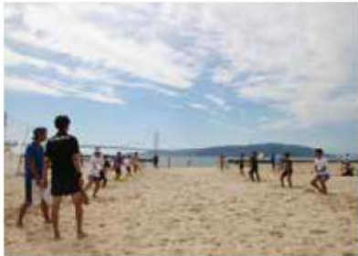
良質な砂浜でビーチスポーツを楽しむ

のために重要な要素であると認識している。具体的には、交通渋滞の解消や改善に向けた安全で利便性の高い幹線道路の整備、踏切の安全対策や歩道の整備などのほか、安定した水源の確保と施設の長寿命化など、持続可能な上下水道の構築に取