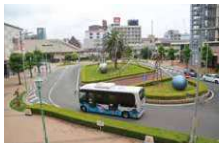
大久保駅南ロータリー

施設用地は、今年度はマンションのモデルルームとして貸し出し、中部地区保健福祉センター用地は、令和7年度まで駐車場として貸し出している。また、築40年が経過し、老朽化が進む大久保市民センターは、行政窓口の機能以外にも会議室や地域住民の交流スペースとして活用している。今後は、必要な機能について検討していく。図書館を含む複合施設は、駅南ロータリーに限定するので