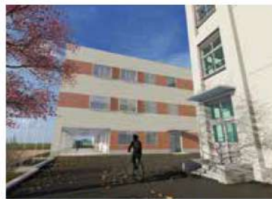
明石商業高校福祉科(完成予想図)

問 明石商業高校福祉科の開設に向け、生徒募集の取り組みを聞く。 答 同校では、卒業時に介護福祉士国家資格の取得を目指す福祉科を令和6年4月に開設する準備を進めている。しかし、県立の福祉系高校の3校全てが3年連続で定員を下回り、生徒募集活動は重要な課題と認識している。