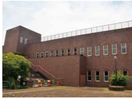
旧市立図書館(県立明石公園内)

答 県立明石公園内の旧市立図書館は、公園管理者である県から設置管理許可を得て、市が建設・維持管理してきたが、現在は図書館としての機能を有しておらず、設置管理許可の期限も今年3月に切れている。また、建物の解体には約8億円か