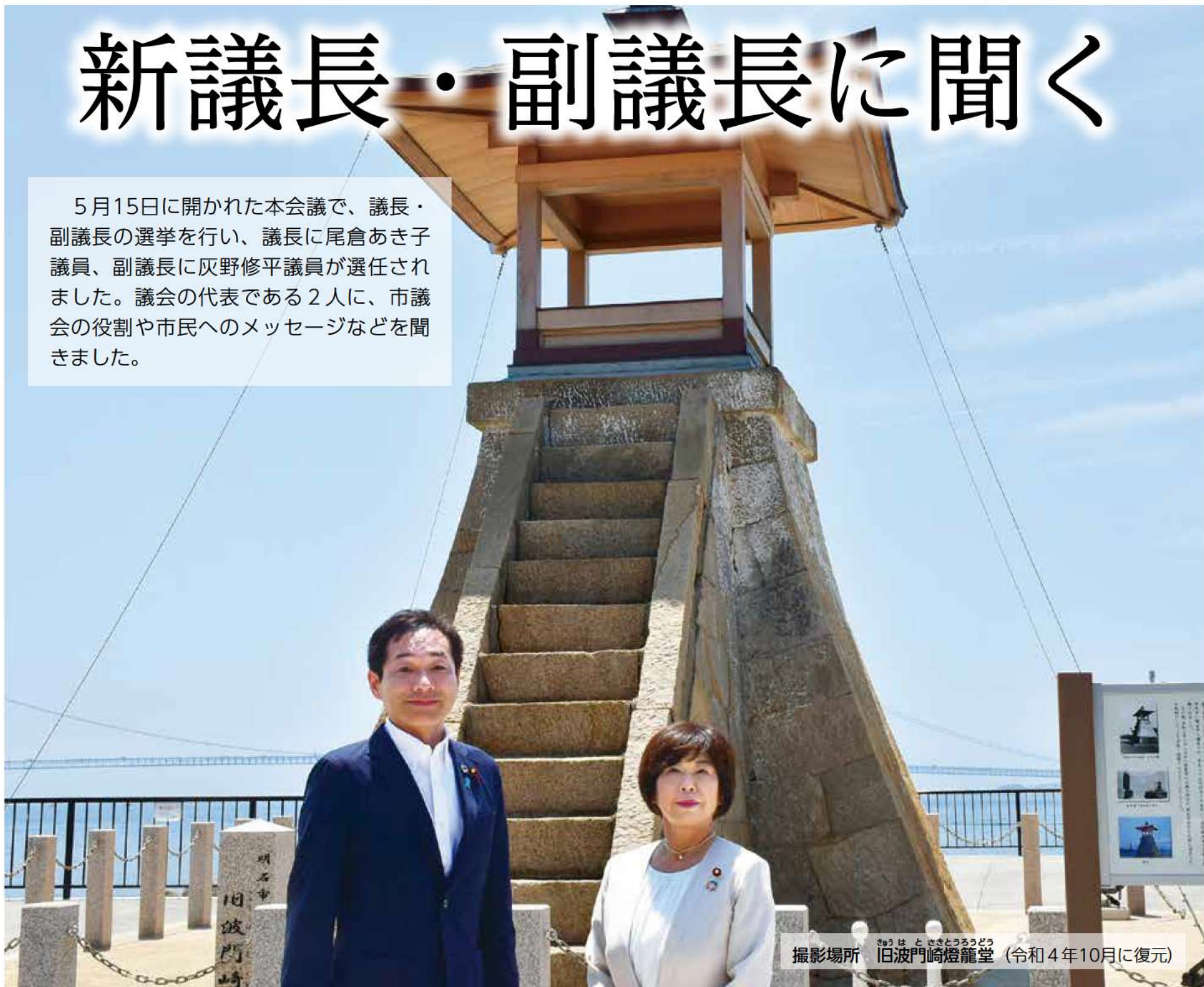
撮影場所 あかし市とさきとうろつどう 旧波門崎燈籠堂 (令和4年10月に復元)