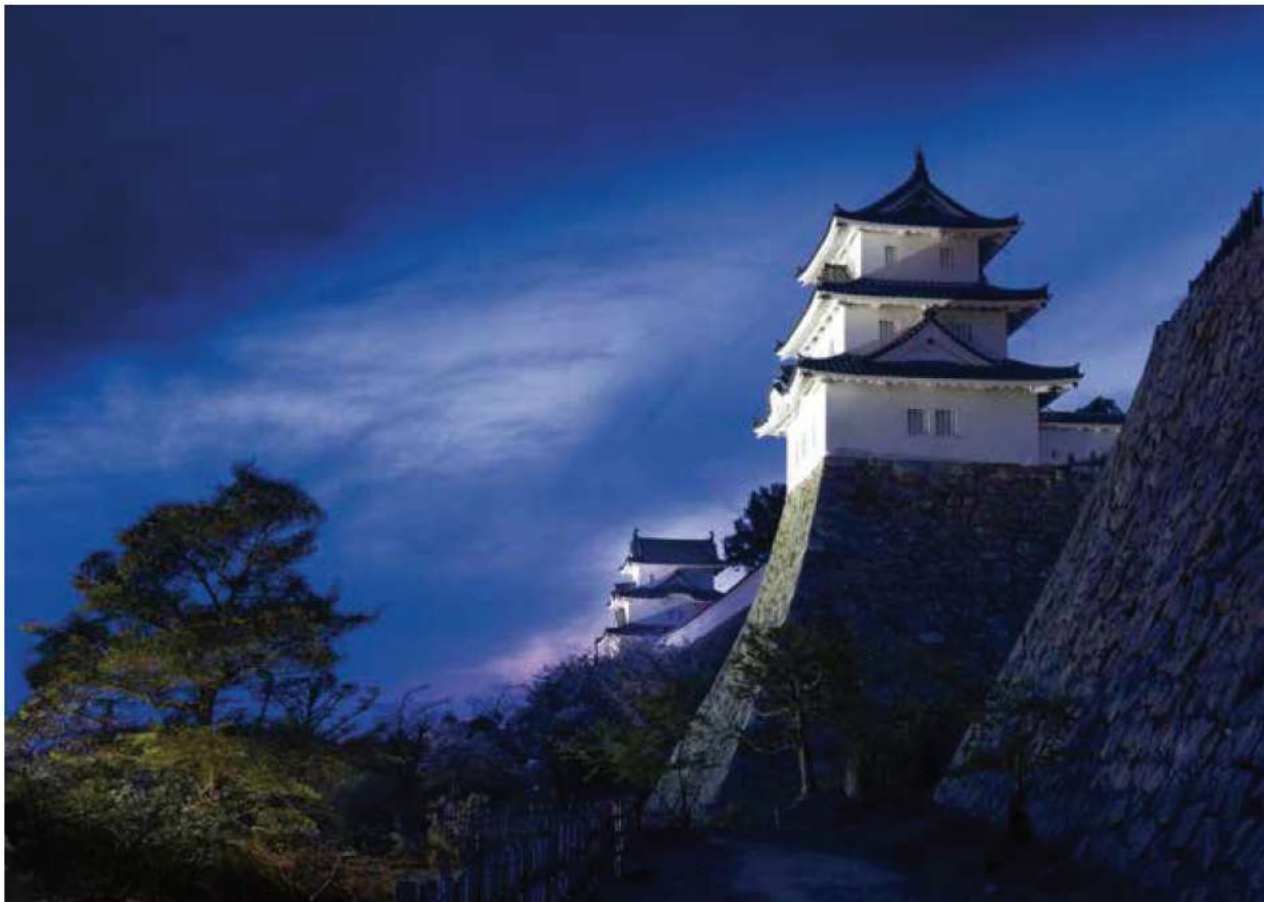
闇夜に浮かぶ明石城

令和5年第2回定例会6月議会が6月9日から6月30日まで開かれました。令和5年度明石市一般会計補正予算(第3号)を修正可決したほか、明石市国民健康保険条例の一部を改正する条例制定などの議案18件を可決・同意、報告7件を了承、請願1件を不採択としました。