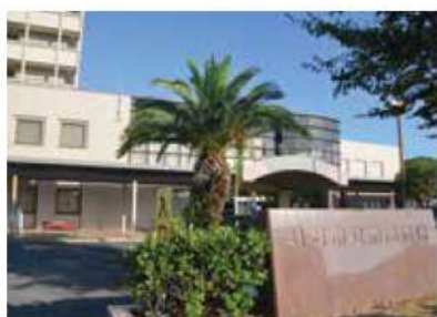
地域医療を担う市民病院

市民のための病院として、医療需要や時代状況に応じて必要な医療の提供に努めてきた。特に新型コロナウイルス感染症の対応は、市内発生の当初から迅速に体制を整備し、地域の自治体病院としての