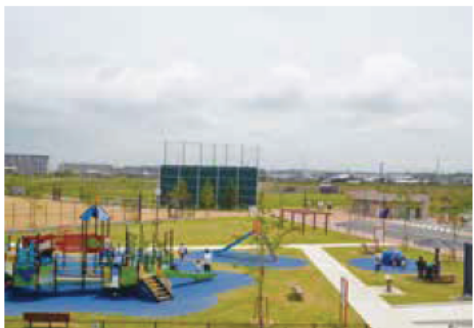
無料開放は9月30日まで(17号池魚住みんな公園)

委員からは、みんなにやさしいをコンセプトに掲げた公園を有料にする意図や料金体系について質問がありました。市からは、良好なグラウンド状態を維持するためには、管理人の設置や定期的なメンテナンスの費用が必要となること