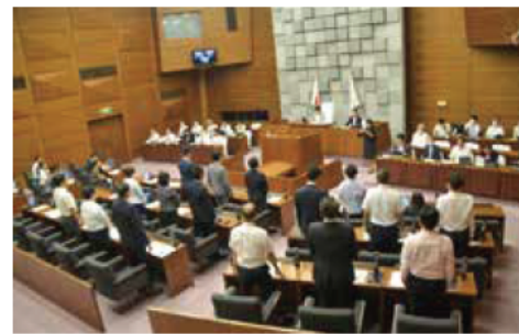
賛成多数で修正案を可決

6月30日の本会議では、市民全員・事業者サポート事業について、給付額を1人当たり3千円から2千円に減額する令和5年度明石市一般会計補正予算(第3号)の修正案を賛成多数で可決しました。