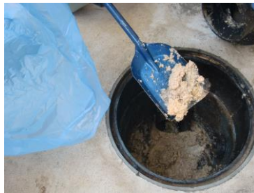
網おたまやひしゃくで油の 固まりやゴミ等を取り除く