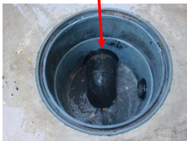
エルボを設置した枳