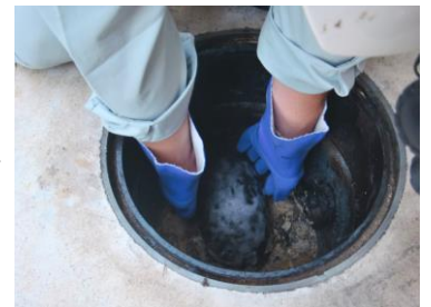
エルボを取り外す