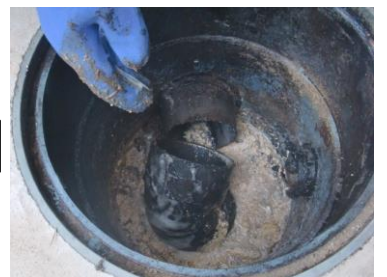
沈殿しているゴミも取り除く