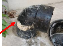
取り外したエルボ