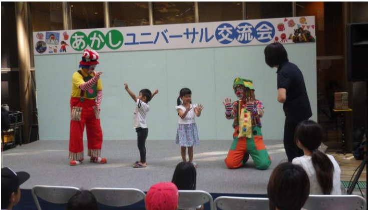
【耳の聞こえないピエロとパントマイム】