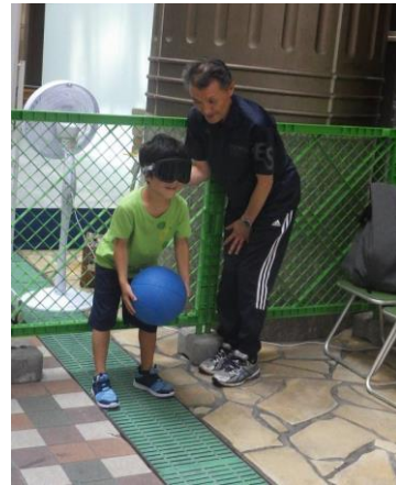
【ゴールボール体験】