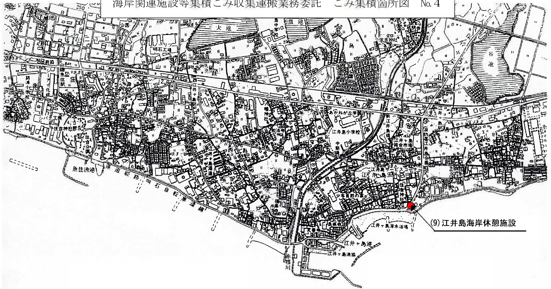
(9) 江井島海岸休憩施設