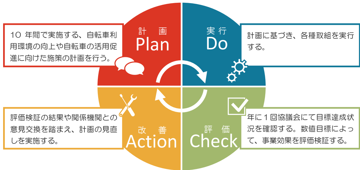
図 PDCA サイクル

本計画に示した“はしる”“まもる”“とめる”“いかす”の4つの基本方針を柱とした各種の取組みを推進していくため、本計画（Plan）の取組を実施（Do）するとともに、前ページで設定した計画目標（数値目標）によって計画全体の評価（Check）を行い、必要に応じて計画の課題反映（Action）を実施していきます。